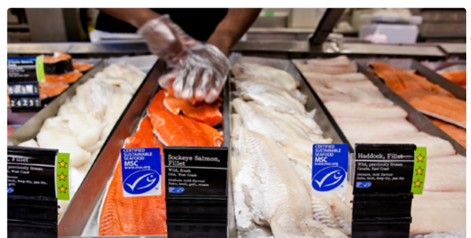
Loblaw Companies Limited, Canada

Grâce au label MSC, les acheteurs de produits de la mer, les transformateurs, les distributeurs et les entreprises de restauration peuvent prouver à leurs clients qu'ils achètent des produits venant des pêcheries les plus durables au monde. Ces entreprises jouent un rôle essentiel pour rendre les produits de la mer certifiés durables disponibles pour les acheteurs et les consommateurs, et ainsi créer une demande pour ces produits.