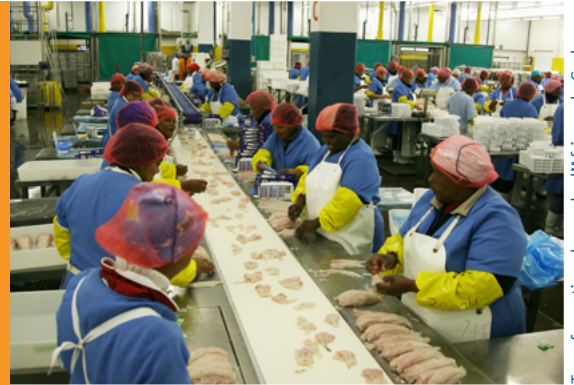
Transformation du merlu d'Afrique du Sud

La révision du Référentiel Chaîne de Garantie d'Origine du MSC permet de le rendre plus accessible pour une large diversité d'entreprises, et en améliore l'efficacité et la rigueur.